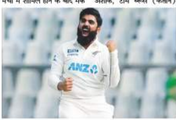
ऑस्ट्रेलिया के आगामी दौरे के लिए न्यूजीलैंड ए टीम की घोषणा कर दी गई है। टीम में सात अंतरराष्ट्रीय खिलाड़ी शामिल हैं। इस दौरे पर न्यूजीलैंड ए की टीम ऑस्ट्रेलिया ए के खिलाफ दो प्रथम श्रेणी चार दिवसीय मैच और तीन 50 ओवर के मैच खेलेगी।