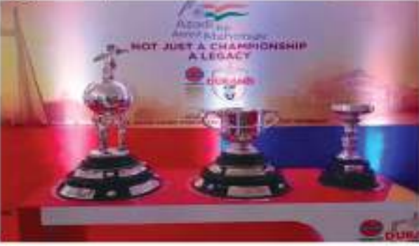
टूर्नामेंट का तीसरा क्वार्टर-फाइनल मैच 26 अगस्त को इंदिरा गांधी एथलेटिक स्टेडियम, स्टेडियम, गुवाहाटी में नोर्थईस्ट युनाइटेड एफ.सी. के बीच खेला जाएगा, जबकि चौथा क्वार्टर-फाइनल मैच 27 अगस्त को विवेकानंद युवा भारतीय क्रिकेट, कोलकाता में मोहन बगान सुपर जायंट्स और मुंबई सिटी एफ.सी. के बीच खेला जाएगा।

कोलकाता। 132वें डूरंड आयल डूरंड कप के क्वार्टर-फाइनल मैचों के कार्यक्रम की घोषणा स्थानीय संगठन समिति द्वारा एक वचुअल मीटिंग में की गई। टूर्नामेंट के क्वार्टर-फाइनल मैच 24 से 27 अगस्त तक खेले जाएंगे। इस मीटिंग में क्वार्टरफाइनल में पहुंची आठ टीमों के प्रतिनिधि भी थे। बदलते मौसम की असुविधाओं के कारण, बदलती खेलने की स्थितियों को ध्यान में रखते हुए प्रथम क्वार्टर-फाइनल को कोकाशाहा से गुवाहाटी स्थानांतरित करने का निर्णय भी लिया गया। टूर्नामेंट का पहला क्वार्टर फाइनल मैच 24 अगस्त को इंदिरा गांधी एथलेटिक स्टेडियम, स्टेडियम, गुवाहाटी में नोर्थईस्ट युनाइटेड एफ.सी. और इंडियन आर्मी एफ. टी. के बीच खेला जाएगा। दूसरा क्वार्टर-फाइनल मैच 25 अगस्त को विवेकानंद युवा भारत क्रिकेट, कोलकाता में मोहन बगान सुपर जायंट्स और मुंबई सिटी एफ.सी. के बीच खेला जाएगा।