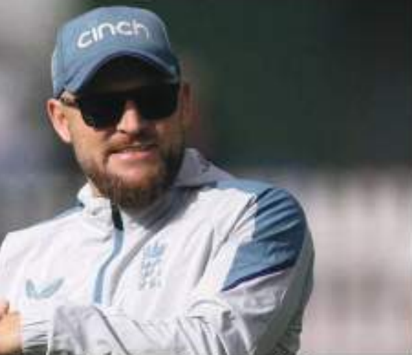
ब्रेंडन मैकुलम के विश्व कप 2023 के लिए सेमीफाइनलिस्ट: भारत (निश्चय रूप से कहा) इंग्लैंड ऑस्ट्रेलिया न्यूजीलैंड

लंदन। आईसीसी विश्व कप 2023 अब बस कुछ ही हफ्ते दूर है। क्रिकेट का महाकुंभ 5 अक्टूबर से भारत में शुरू होगा और फाइनल 19 नवंबर को होगा। टूर्नामेंट की शुरुआत इंग्लैंड और न्यूजीलैंड के बीच बल्लेबाजों के मुकाबले से होगी। लेकिन इससे पहले भविष्यवाणियों का दौर शुरू हो गया है और न्यूजीलैंड के पूर्व कप्तान और इंग्लैंड टेस्ट टीम के कोच ब्रेंडन मैकुलम ने सेमीफाइनल के लिए चार टीमों को शॉर्ट लिस्ट किया है। लेकिन हैरानी की बात यह है कि इसमें पाकिस्तान टीम शामिल नहीं है। भारत में अहमदाबाद, चेन्नई, लखनऊ, मुंबई, पुणे, बेंगलुरु, दिल्ली, कोलकाता, धर्मशाला और हैदराबाद में 10 स्थान खेलों की मेजबानी करेगी। यह टूर्नामेंट 2011 के बाद पहली बार भारत में होगा और इसमें कुल 48 मैच होंगे और 10 टीमों खिताब के लिए भिड़ेंगी। आईसीसी विश्व कप 2023 नजदीक आने के साथ इंग्लैंड के मौजूदा टेस्ट कोच ने भारत, ऑस्ट्रेलिया, इंग्लैंड और न्यूजीलैंड को चार टीमों के रूप में चुना है। जिस बात ने कई लोगों का ध्यान खींचा