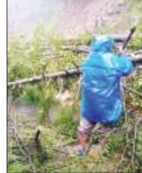
समीप भूस्खलन के कारण बंद हो गया है। हालांकि जुग्गा-छलंडा

रोड बड़ेच के समीप बंद हो गया था जिसे विभाग द्वारा जैसीबी लगाकर वाहनों की आवाजाही के लिए खोल दिया है। इसी प्रकार छलंडा पीरन सड़क भी कई स्थानों पर लहासे गिरने से अवरुद्ध हो गया था जिसे विभाग द्वारा खोल दिया गया है। बता दें कि जुग्गा साधुपुल रोड़ कून नाले के पास बौते दो माला भूस्खलन से बाद बार बंद हो रहा है। इस नाले में लगाता भूस्खलन होने से विभाग को खोलने के लिए काफी मुश्किल पड़ रही है।