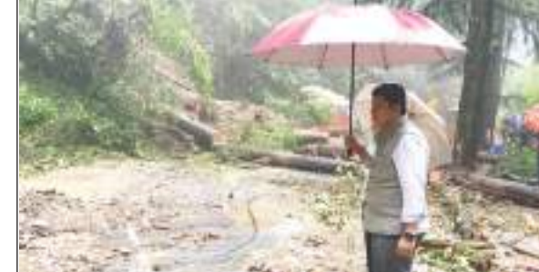
निर्देश दिए ताकि लोगों को आवागमन की सुविधा उपलब्ध हो सके। उपायुक्त ने बताया कि भारी बारिश एवं आपदा की इस घड़ी में