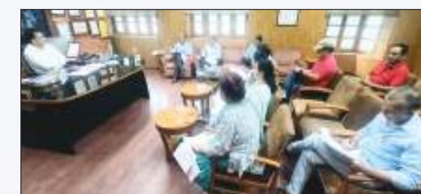
किया जाएगा साथ ही नए रेडक्रॉस भवन निर्माण के भी टेंडर हो गए हैं, उक्त दोनों भवनों के निर्माण का कार्य शीघ्र ही आरम्भ किया जाएगा। बैठक में वर्ष 2023-24 की अंकेक्षित बजट शीट तथा वार्षिक रिपोर्ट को भी मंजूरी प्रदान की गई। उपायुक्त ने बताया कि आपदा के दौरान प्रभावित लोगों को तुरंत राहत के

रूप में जिला रेडक्रॉस द्वारा 3601 तिरपाल, 50 गद्दे, 300 पानी की बोतलें प्रदान की गई थीं। इसके अतिरिक्त राज्य रेड क्रॉस की ओर से भी तिरपाल, कमबल, बाल्टियाँ, किचन सेट, हाइजीन किट, फैमिली टेंट इत्यादि वितरित किए गए। उपायुक्त ने बताया कि अभी तक विभिन्न गैर सरकारी संगठनों सहित रेड क्रॉस के माध्यम से कुल 10 हजार तिरपाल वितरित किए गए हैं। इन्होंने कहा कि भविष्य में जिला दिव्यांग पुनर्वास केंद्र का विस्तार किया जाएगा ताकि अधिक से अधिक लोगों को इसका लाभ मिल सके। इसके अतिरिक्त विभिन्न स्थानों पर स्वास्थ्य जांच एवं दिव्यांग