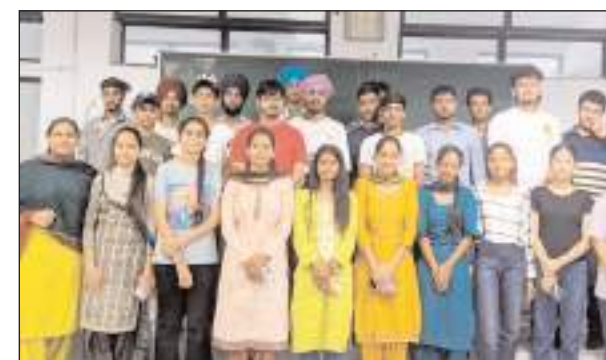
के साथ सहयोग करते हैं, उनमें टीम वर्क, संचार और समस्या-समाधान कौशल विकसित होते हैं। उन्होंने बताया कि प्रतियोगिता में प्रथम स्थान के विजेताओं में तीसरे सेमेस्टर से बी. फामेसी विभागा, तीसरे सेमेस्टर से वी.टेक सीएसई और दूसरे सेमेस्टर से डी. फामेसी विभाग शामिल थे। वहीं दूसरे स्थान के विजेताओं में पहले सेमेस्टर से