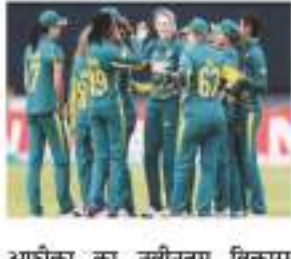
दक्षिण अफ्रीका का नवीनतम विकास राष्ट्रीय महिला टीम के लिए बेहद सफल 18 महीनों के बाद आया है जिसे उन्हें 2022 में न्यूजीलैंड में महिला क्रिकेट विश्व कप के सेमीफाइनल तक पहुंचाया और फिर इस साल की शुरुआत में महिला टी20 विश्व कप की मेजबानी करते समय फाइनल में जगह बनाई।