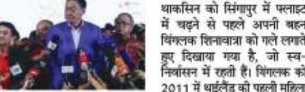
देश लौट आए हैं। 74 वर्षीय थाकसिन 2001 में थाईलैंड के प्रधानमंत्री बने थे और 2006 में सैन्य तख्तापलट के बाद उन्हें पर से हटा दिया गया था। थाकसिन मंगलवार सुबह 9 बजे एक निजी विमान से बैंकाक के डॉन मुएंग इंटरनेशनल एयरपोर्ट पर पहुंचे।