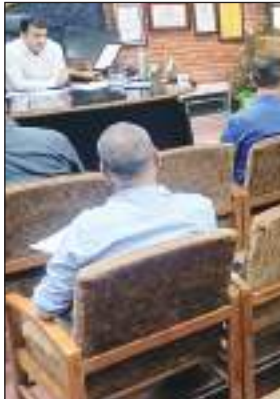
के इलाज के लिए प्रेरित कर उन्हें इलाज उपयुक्त पुर्नवासित करना है। इसके लिए उन्होंने केन्द्र के कार्यो तथा सफलता से संबंधित एक डॉक्यूमेंट्री फिल्म तैयार करने के

अधिकारिक जागरूकता शिविर लगाने के निर्देश दिए। उपायुक्त ने बताया कि केंद्र में सुरक्षा कर्मी तथा सफाई कर्मी की नियुक्ति के लिए मामला सरकार को प्रस्तुत किया