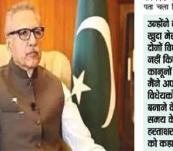
कर दिया गया है। हालांकि, मुझे अब पता चला कि मेरे कर्मचारियों ने मेरी इच्छा और आज्ञा को नहीं माना। मैं उन लोगों से माफी मांगता हूँ जो प्रभावित होंगे।' इसके साथ ही उन्होंने अपने सचिव यकार अहमद को बर्खास्त किया था कि उन्होंने अपने कर्मचारियों को बिना हस्ताक्षर किए वापस करने का निर्देश दिया था। इस बीच, पाकिस्तान पीपुल्स पार्टी (पीपीपी) और पाकिस्तान मुस्लिम लीग-नवाज (पीएमएल-एन) ने राष्ट्रपति के इस्तीफे की मांग की है। पीपीपी के प्रवक्ता फैसल करीम कुंडी ने इस घटना को दुर्भाग्यपूर्ण और अल्वी को राष्ट्रपति पद के लिए अयोग्य व्यक्ति बताया और दावा किया कि उन्हें नहीं पता कि उनके आसपास क्या हो रहा है। पीपीपी उपाध्यक्ष शरी रहमान ने कहा कि यह घटनाक्रम अल्वी के राष्ट्रपति बने रहने की क्षमता पर सवाल उठाता है। क्या वह यह कहना चाह रहे हैं कि किसी और ने उनकी नाक के नीचे से विधेयक पर हस्ताक्षर किए हैं। रहमान ने कहा कि अगर ऐसा है, तो राष्ट्रपति को इस्तीफा दे देना चाहिए। पीएमएल-एन नेता और पूर्व वित्त मंत्री इराक खर ने अल्वी के बयान को अविश्वसनीय बताया और उनके इस्तीफे की मांग की। उन्होंने कहा कि नैतिकता के अनुसार अल्वी को इस्तीफा देना चाहिए, क्योंकि वह अपने कार्यालय को प्रभावी ढंग से, कुशलतापूर्वक और नियमों के अनुसार चलाने में विफल रहे हैं।

इस्लामाबाद। पाकिस्तान में सेना को ताकतवर बनाने वाले दो विधेयकों के कानून बनने को लेकर सरकार व राष्ट्रपति के बीच शुरू घमासान गहराता जा रहा है। राष्ट्रपति आरिफ अल्वी ने इन विधेयकों पर हस्ताक्षर न करने के ब्रावजुद कानून बन जाने पर आपत्ति जताते हुए अपने सचिव को बर्खास्त कर दिया है। दो प्रमुख राजनीतिक दलों की ओर से उनके हस्ताक्षर की मांग की गयी है। दरअस्त, पिछले दिनों पाकिस्तान की सीनेट ने आधिकारिक गोपनीयता (संशोधन) विधेयक, 2023 और पाकिस्तान सेना (संशोधन) विधेयक, 2023 हस्ताक्षर के लिए राष्ट्रपति आरिफ अल्वी के पास भेजे थे। बीते दिनों इन्हें कानून के रूप में अधिसूचित किये जाने पर अल्वी ने सोशल मीडिया पर जानकारी दी कि उन्होंने दोनों विधेयकों पर हस्ताक्षर नहीं किए हैं, क्योंकि वह दोनों ही बिलों से असहमत थे। अल्वी ने अपने कर्मचारियों पर धोखा देने का आरोप लगाया। उन्होंने कहा, 'जैसा कि खुद मेरा गवाह है, मैंने दोनों विधेयकों पर हस्ताक्षर नहीं किए, क्योंकि मैं इन कानूनों से असहमत था। मैंने अपने कर्मचारियों से विधेयकों को अप्रभावी बनाने के लिए निर्धारित समय के भीतर बिना हस्ताक्षर किए वापस करने को कहा। मैंने उनसे कई बार पूछा कि क्या उन्हें वापस कर दिया गया है और मुझे आश्चर्य कि बताया गया था कि उन्हें वापस