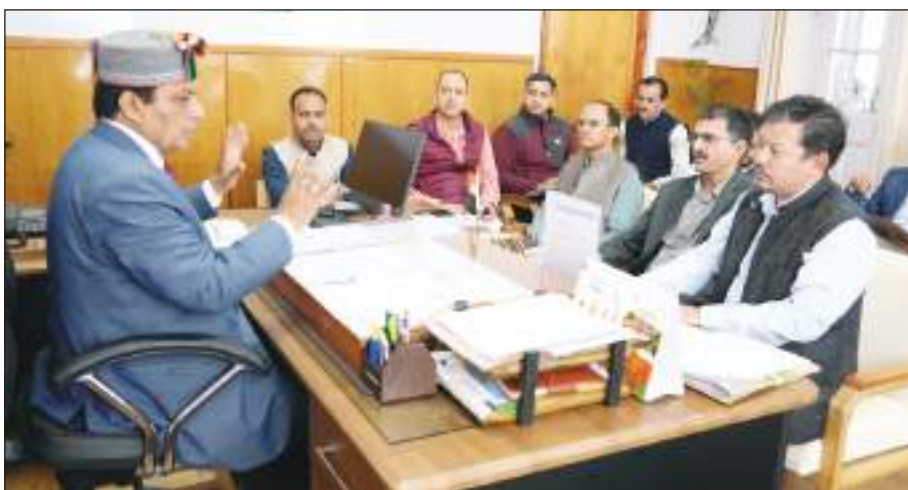
सामुदायिक केन्द्र का निर्माण किया जाएगा। इस केन्द्र के निर्मित होने से प्रदेश के सभी वर्गों के लोग लाभान्वित होंगे। उन्होंने अधिकारियों से इस संबंध में एफसीए मामले के शीघ्र समाधान

को निर्देश दिए। उन्होंने सभी सम्बद्ध विभागों के अधिकारियों को परियोजना निर्माण क्षेत्र का सर्वेक्षण कर शीघ्र रिपोर्ट तैयार करने के निर्देश दिए। उन्होंने कहा कि सामुदायिक केन्द्र का निर्माण